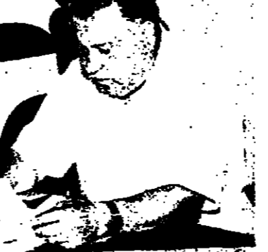
الحياة على بيعتها مديدة جدا من الخيال ، في بداية حياة كل فنان لا يد على انسان يسكب بيده ليساعده من تخطي العقبات الاولى ، فمن هم اولئك الذين اعتمدت عليهم في ذلك ؟

في الحقيقة لقد خرجت من المدرسة المتوسطة الثانوية في حين عام 1960 ، ولدي ميل فنية ورغبة في الفن اذ اتيتهما بالدراسة والمطالعة بالاضافة الى مطوية ايل التي في نفسي . وقد عشت ايام ما قبل 1967 دورات عديدة في الوية الارمن لمعلمي التربية الفنية في بيت حينا ، وكانت مدة الدورة منها ستة اسابيع تلقى المشتركين فيها اعمال الجبس والصلصال والقي والخيزران والمجونات بقواعدها ، وقتت احد الذين دروا في هذه الدورات مع زملا لي كثيرين اخس منهم القليل جبر نيروخ . ايا بعد عام 1967 ، فكان لابد لكل الحاة على بيعتها مديدة جدا من الخيال ، في بداية حياة كل فنان لا يد على انسان يسكب بيده ليساعده من تخطي العقبات الاولى ، فمن هم اولئك الذين اعتمدت عليهم في ذلك ؟